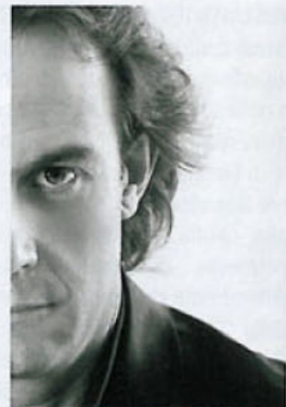
ARCH. PIERLUIGI SAMMARRO

● Le pareti sono modellate per ottenere rientranze e nicchie la cui presenza è enfatizzata dalla carta da parati a strisce e da un'illuminazione che Sammarro ha studiato nei minimi particolari. L'ingresso diretto nel soggiorno è impedito dal prolungamento del pilastro di fianco alla porta, alleggerito però da tre piccole finestre.