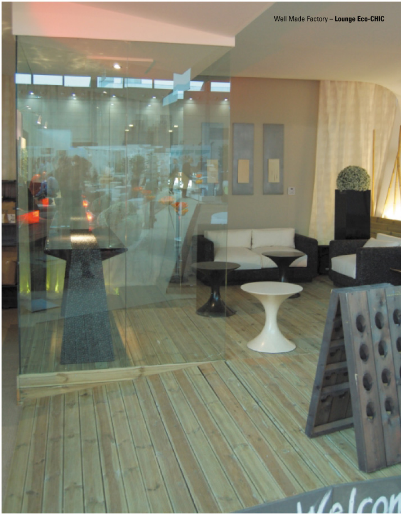
Well Made Factory – Lounge Eco-CHIC

di tutti gli elementi che possano creare il massimo benessere nell'ospite in termini di comfort psico-fisico: la percezione di benessere (studio della distribuzione dello spazio, uso del colore, ecc.) e, in particolare, lo studio dell'involucro edilizio, l'uso di materiali e tecnologie sostenibili, da cui oggi nessuna struttura ricettiva può prescindere. Attraverso la realizzazione della SPA SUITE in fiera, si presenta tangibilmente il risultato di un approccio ad "un'architettura alberghiera energeticamente consapevole",