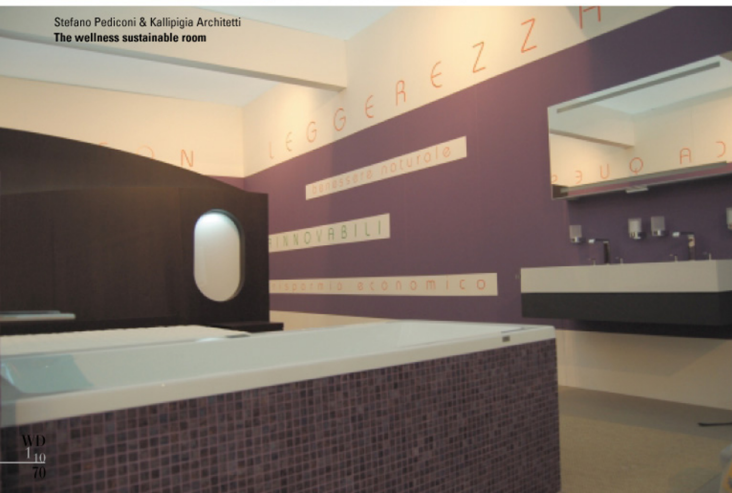
Stefano Pediconi & Kallipigia Architetti The wellness sustainable room