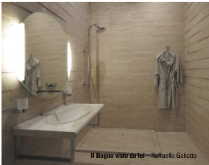
Il Bagno visto da lui – Raffaello Galiotto

E magari, alla fine, portare con noi, a casa, un ricordo: un sasso, di quel luogo, di quel viaggio.