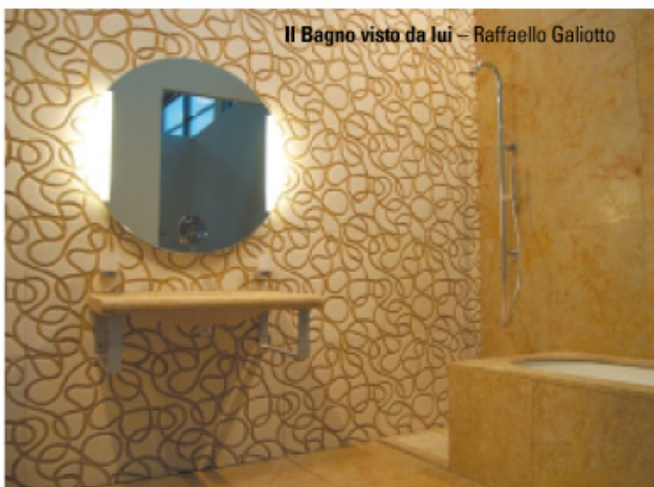
Il Bagno visto da lui – Raffaello Galiotto