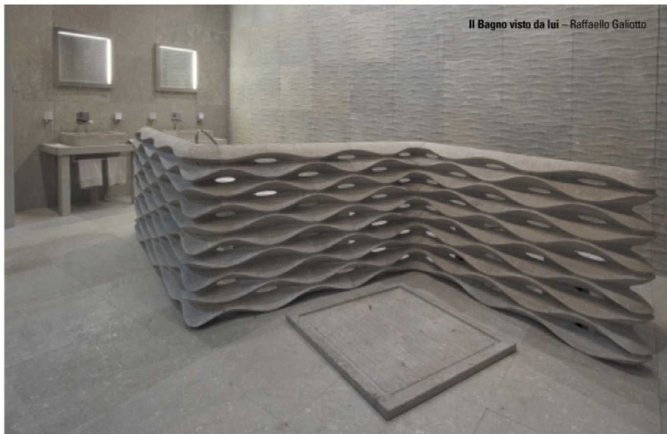
Il Bagno visto da lui – Raffaello Galiotto