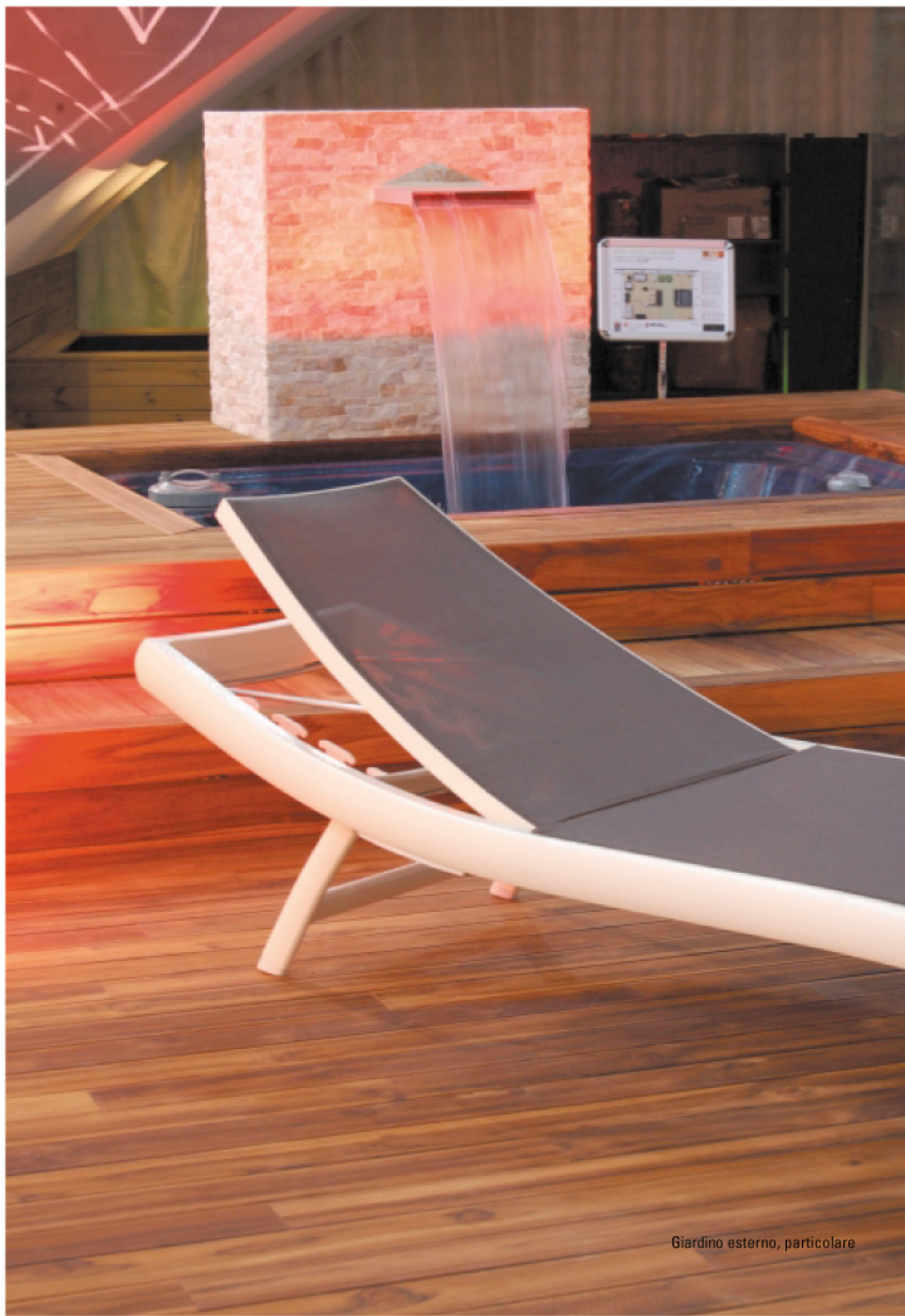
Giardino esterno, particolare