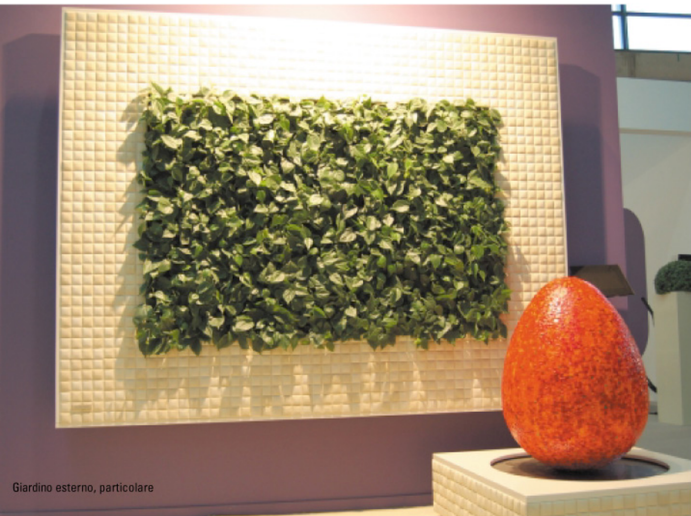
Giardino esterno, particolare