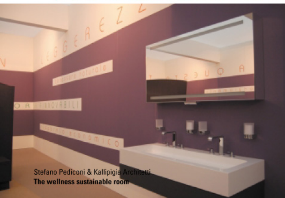
Stefano Pediconi & Kallipigia Architetti The wellness sustainable room

Un innovativo concetto di ristorante metropolitano rivoluzionato nelle sue funzioni e nel suo uso. I desideri espressi dalla clientela riguardo alla qualità del cibo, ecologia dei materiali e relax totale per la persona sono condensati in un nuovo modo di intendere il mondo-spazio ristorazione. Il fruitore contemporaneo si immerge in un sogno dove i servizi ed i benefici classici di una SPA si fondono con quelli di un cool-restaurant sommando gli effetti di una alimentazione salutare a quelli dei trattamenti personali e portando i clienti in un spazio da vivere nel totale relax. All'entrata viene consegnato ad ogni cliente